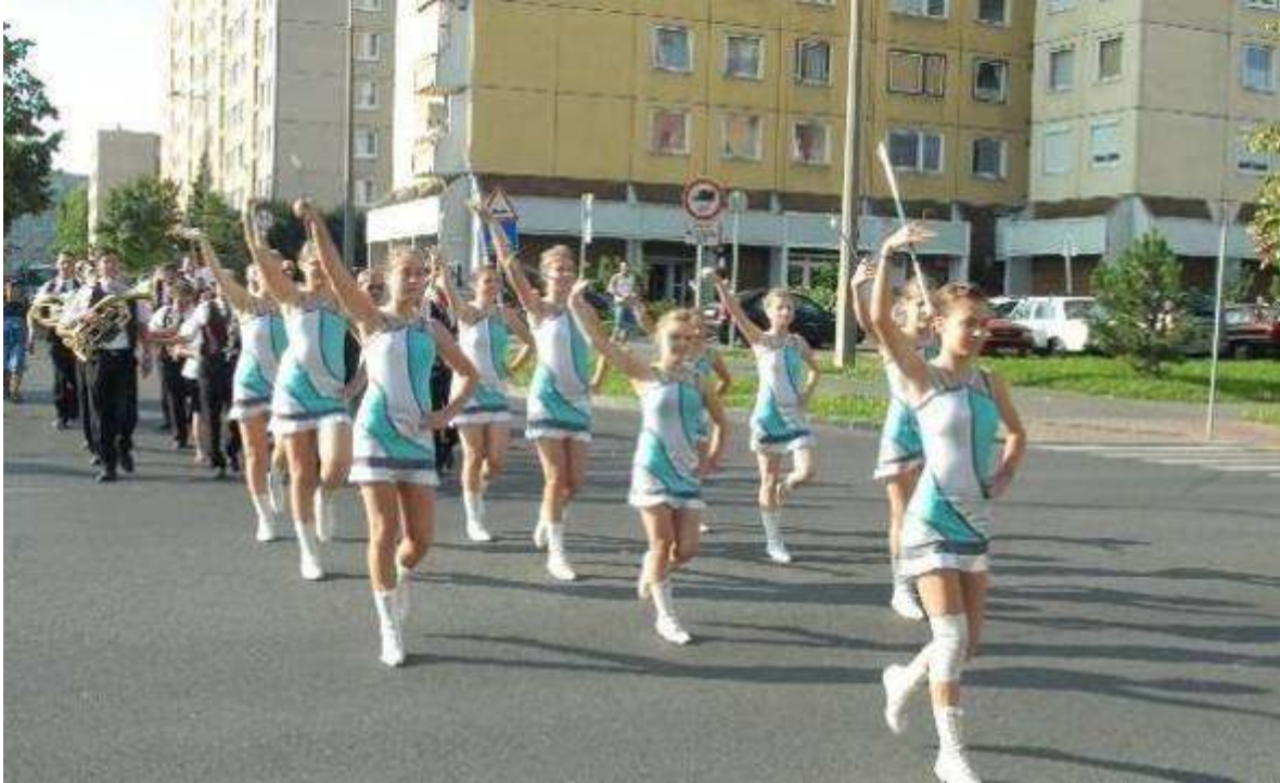
Hagyományos búcsúnyitás zenés ébresztővel és mazzsorettel