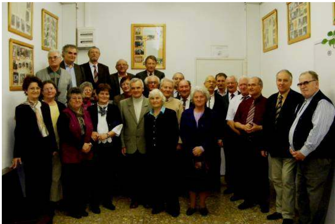
Örökifjú nyugdíjasainknak jó egészséget kívánunk!