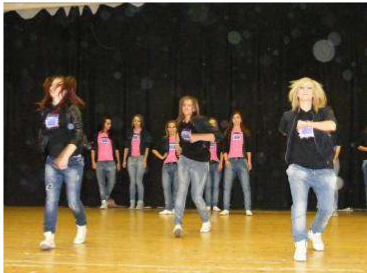
Ennyi lányt ritkán látni a PÁGISZ-ban!