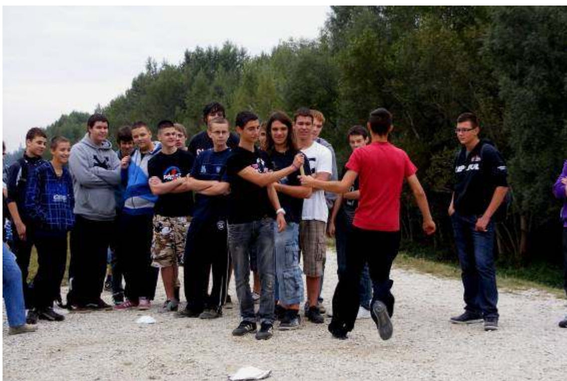
Staféta a 10.B-ben