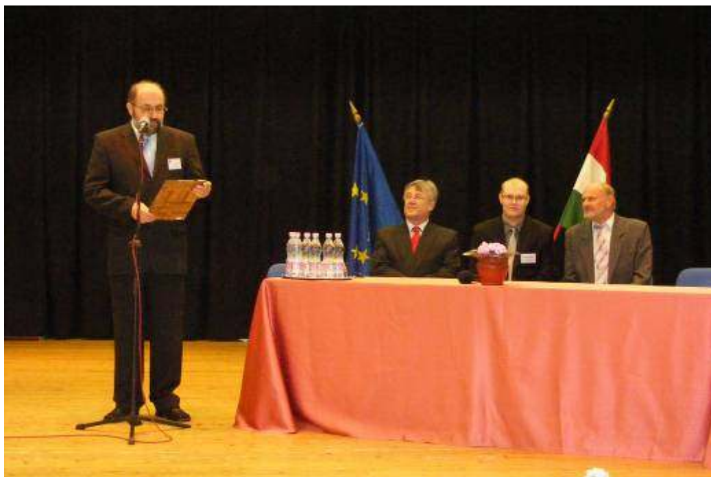
Igazgató úr megnyitja a szakmai versenyt