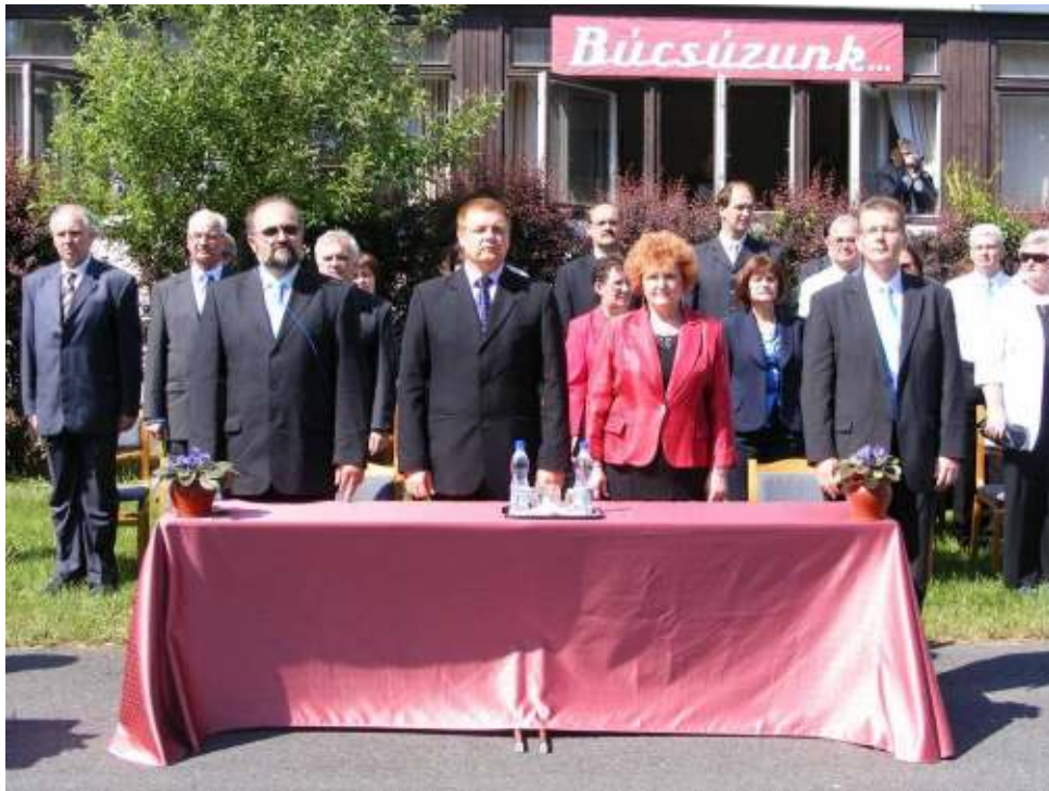
Iskolánk vezetősége és tanári kara