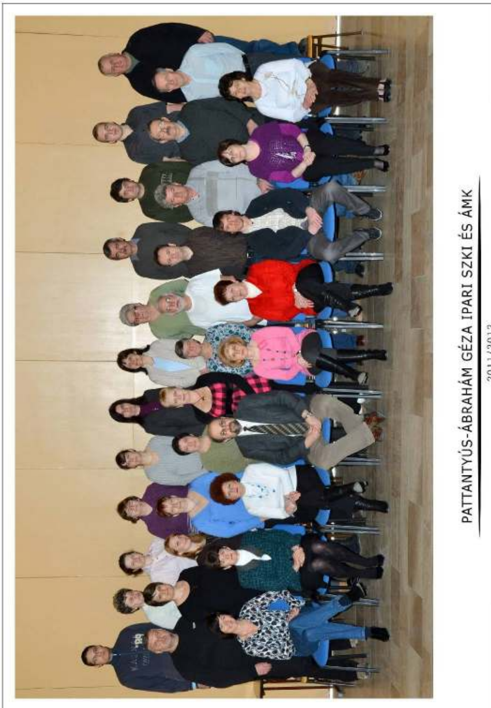
PATTANTYÚS-ÁBRAHÁM GÉZA IPARI SZKI ÉS ÁMK