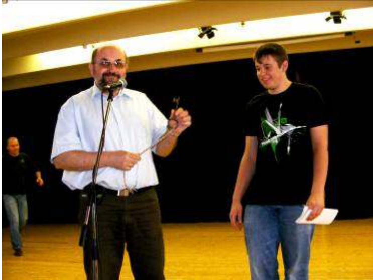
A diákok hatalomátvétele egyetlen napra