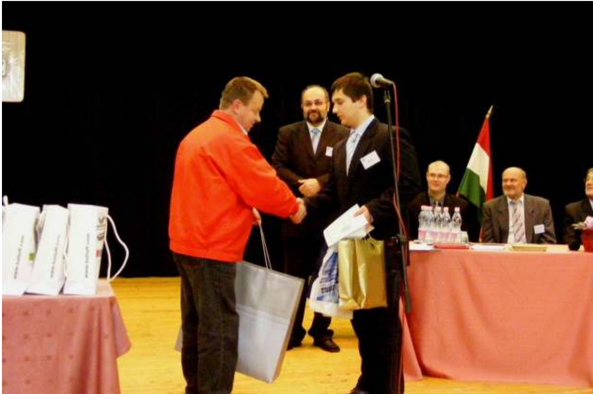
A legjobbak értékes tárgyjutalmakkal gazdagodtak a támogató cégek jóvoltából