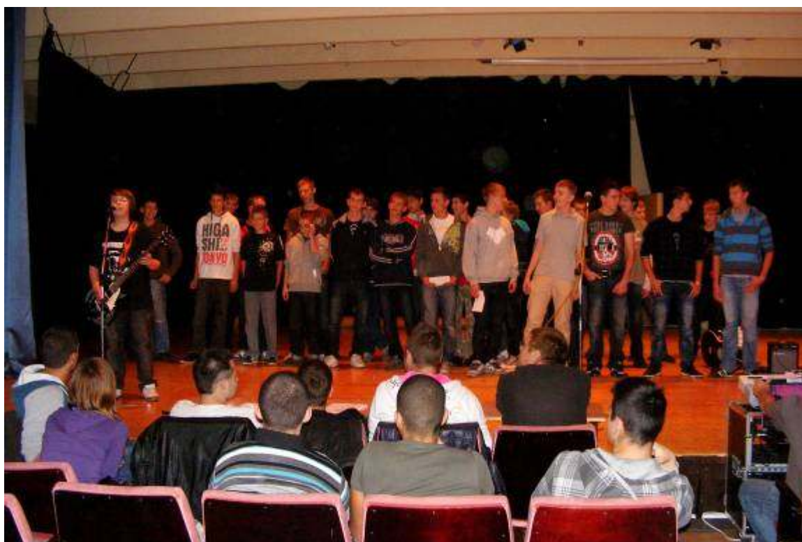
Mi már patyis diákok vagyunk!