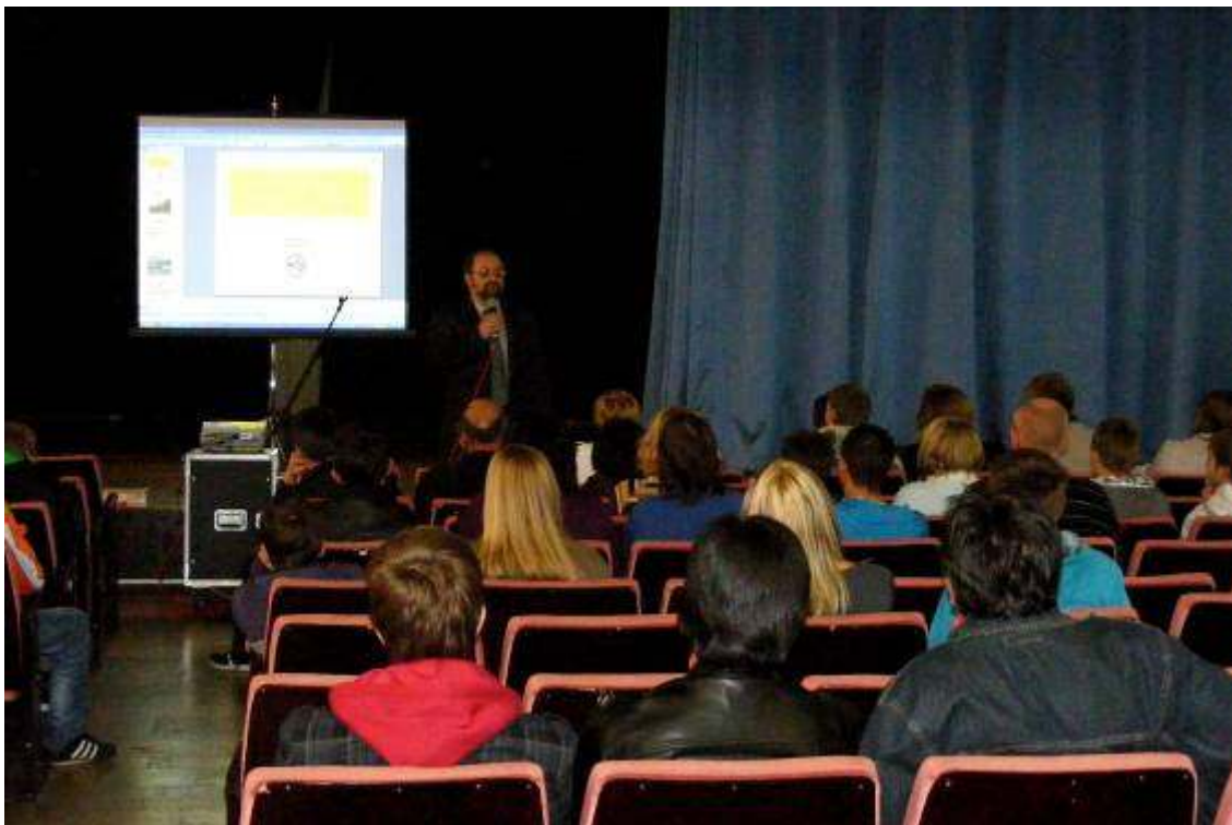
A színházteremben igazgató úr mutatta be intézményünket