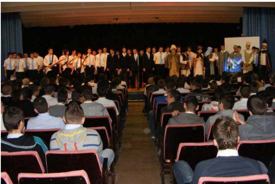
Igazi karácsonyi hangulatot varázsoltak a szereplők, köszönjük nekik!