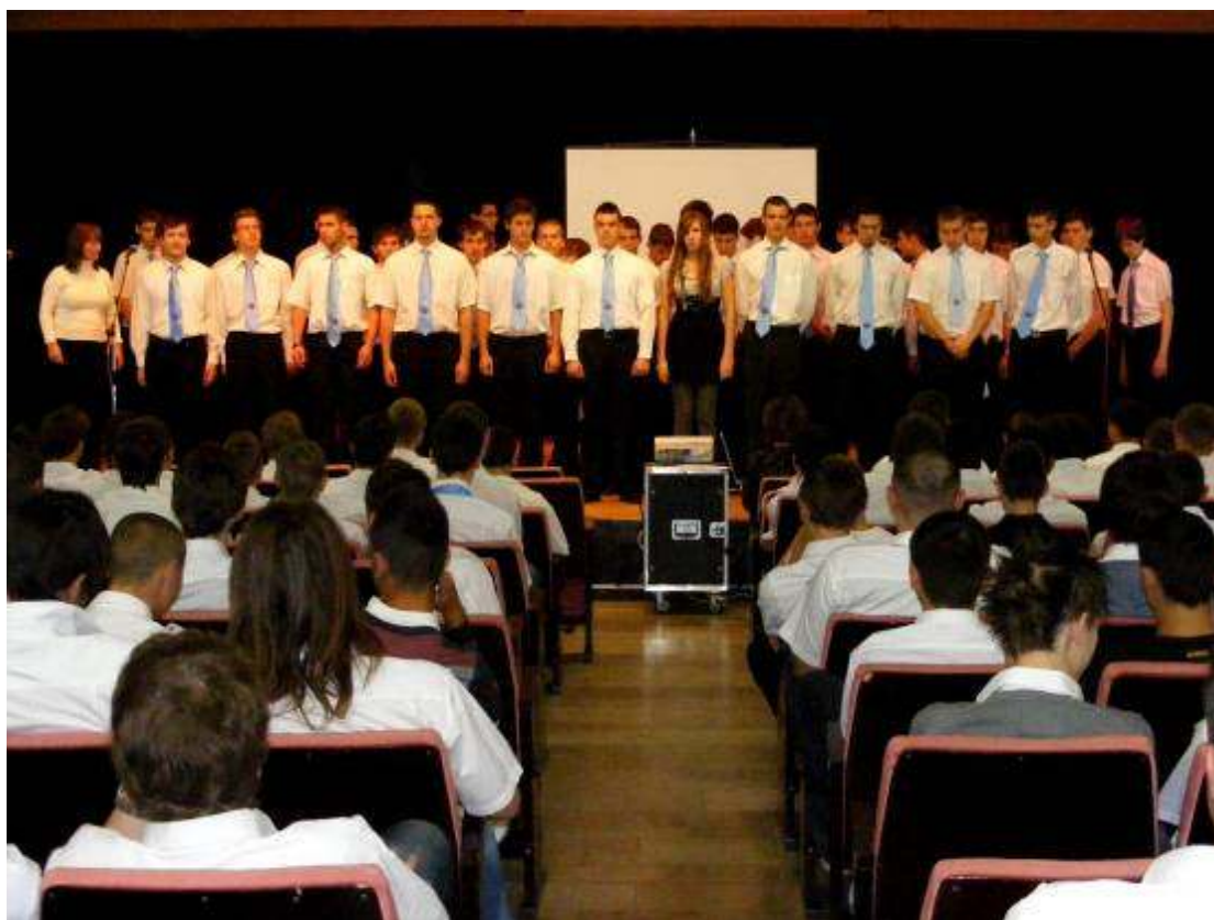
Megemlékezésünk szereplői: a „győri srácok”