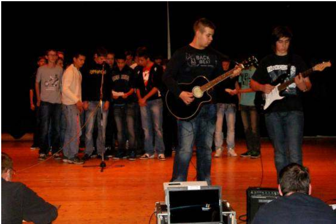
Elsőseink bemutatták zenei tehetségüket is