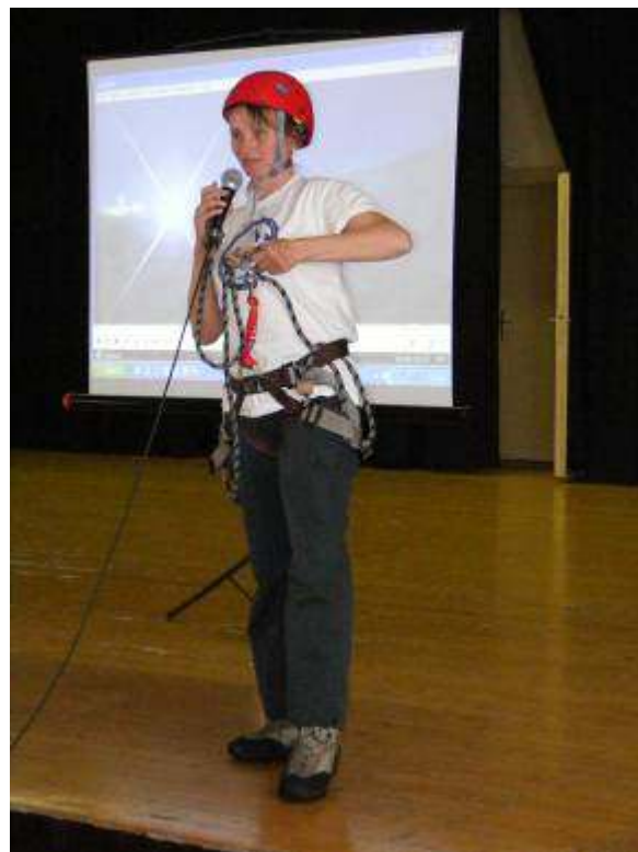
A sziklamászás rejtelseibe is belekóstolhattunk