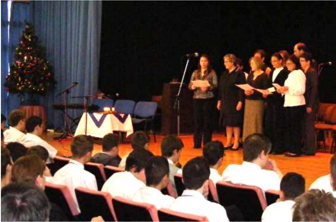
A tanári kórus szereplése már hagyománnyá vált