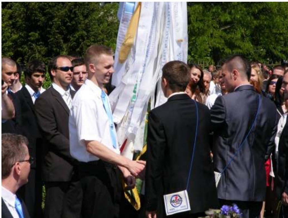
Az iskolazászló átadásával szép hagyomány folytatódik