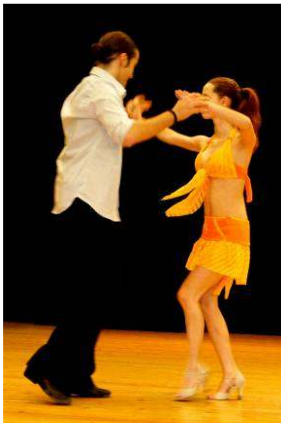
Nyitótánc latin ritmusban