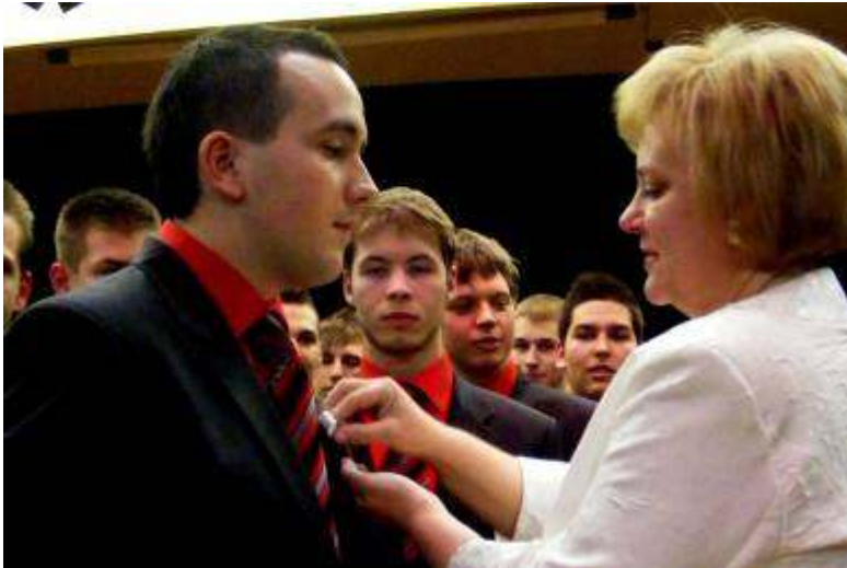
Ünnepélyes pillanatok a 12.C-ben