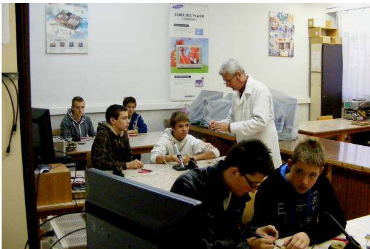
A műhelyekben pedig kipróbálhatták ügyességüket a nyolcadikosok