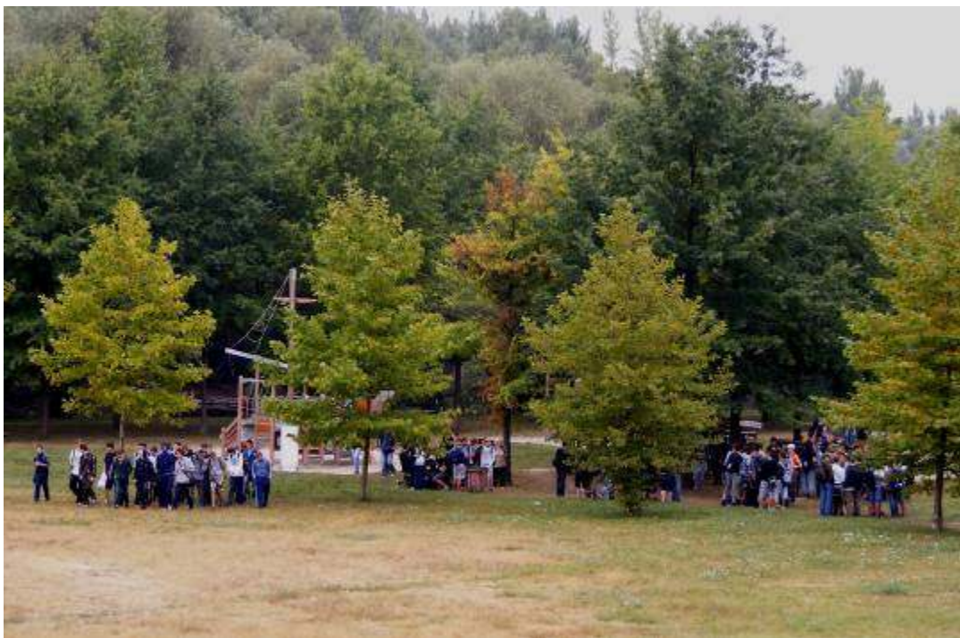
Gyülekező a sportnapra