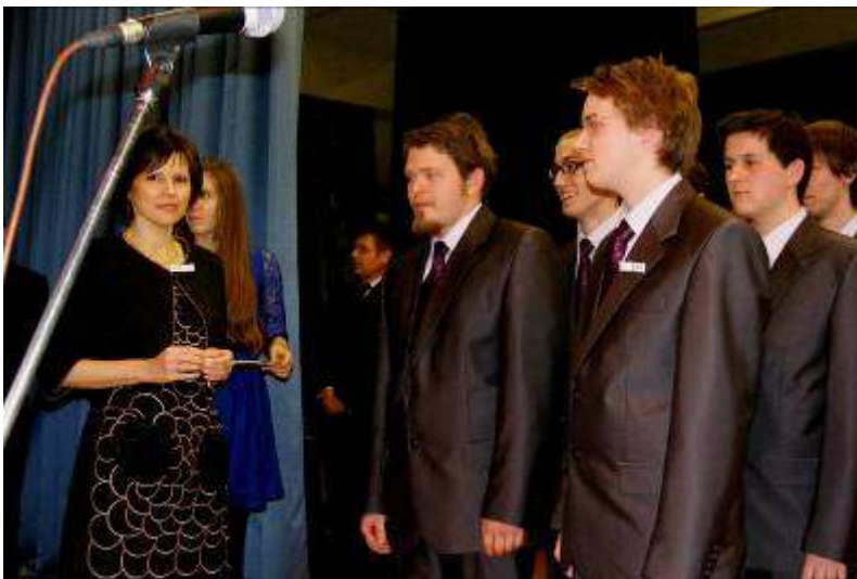
... és a 13.C-ben