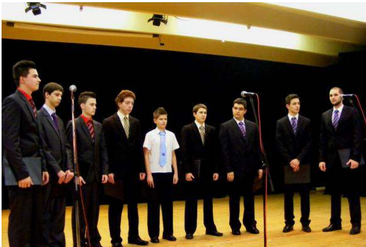
A végzősök (kiegészülve egy kilencedikkel) megható irodalmi műsora