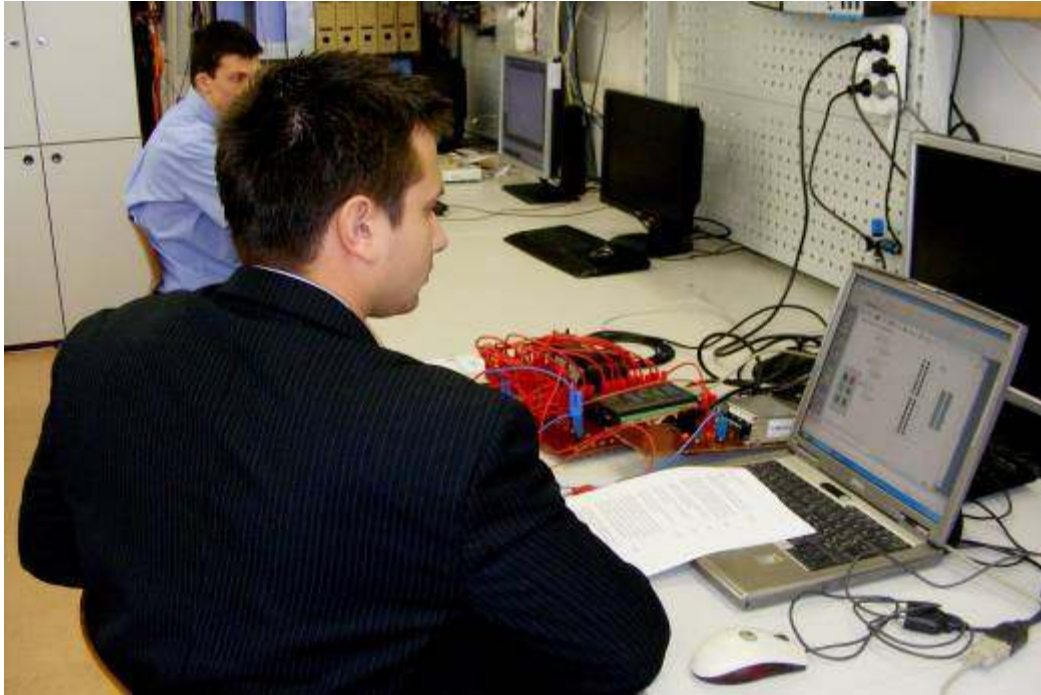
Vajon működni fog?