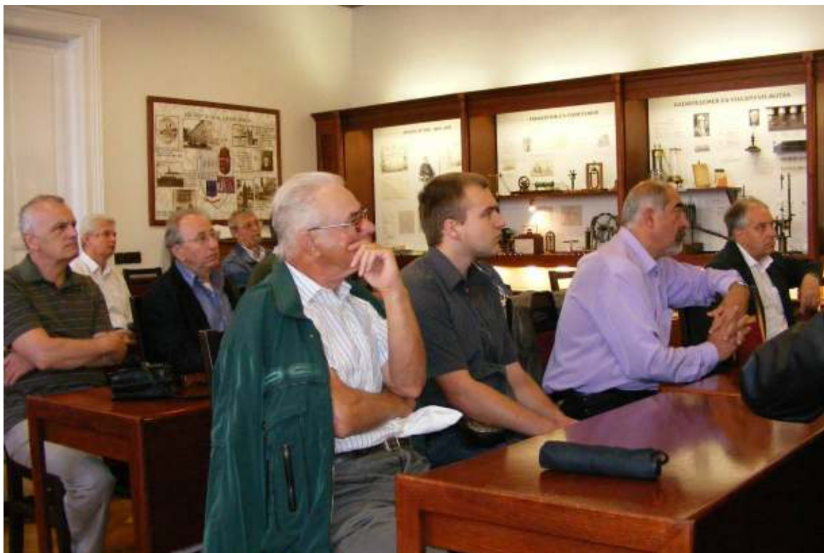
A program: délelőtt múzeumlátogatás