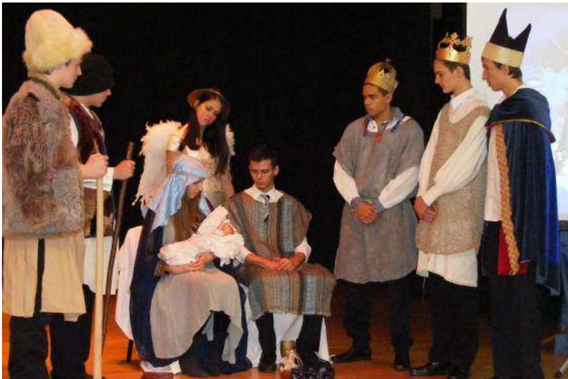
Betlehemi jelenet élőképpen