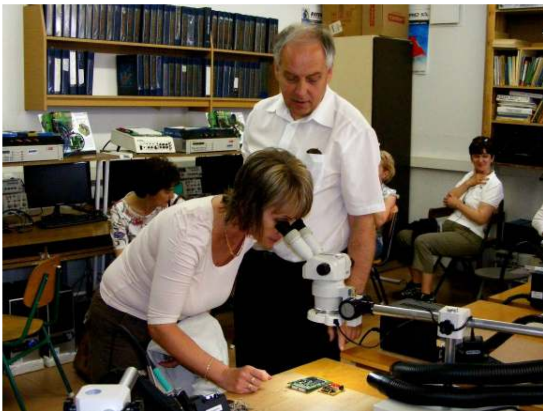
A műszakis kollégák bemutatják laborjaikat