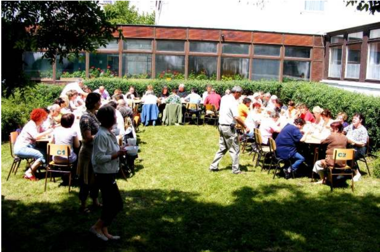
Délután: kerti parti