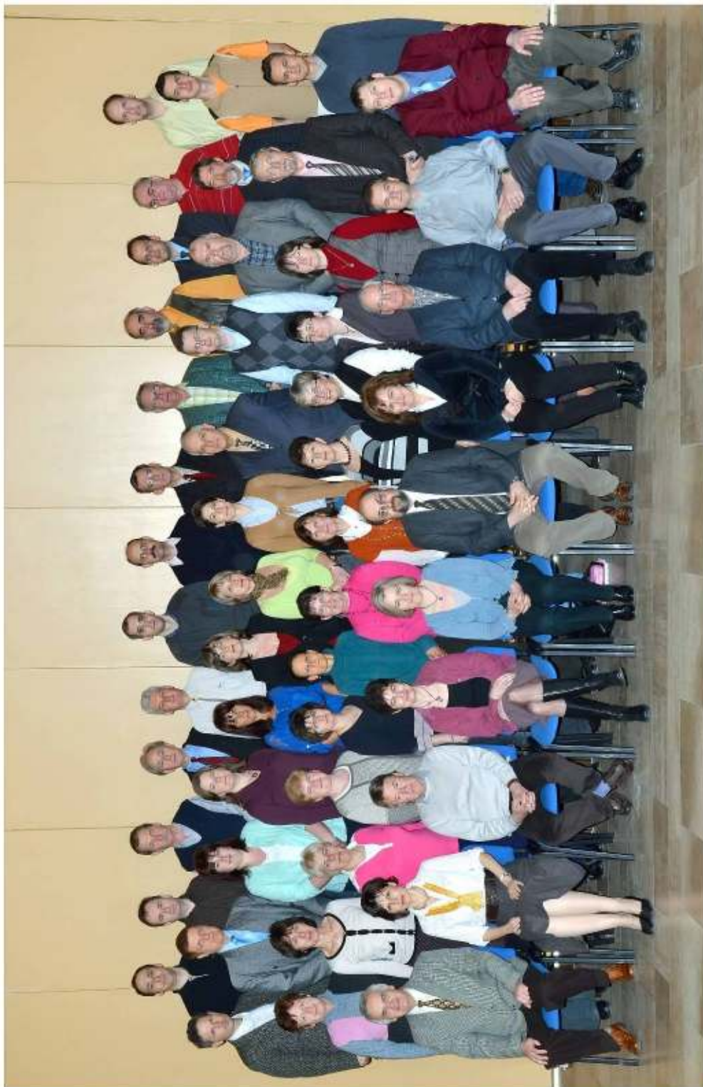
Pattantyús-Á. Géza Ipari Szakközépiskola és ÁMK 2011/2012