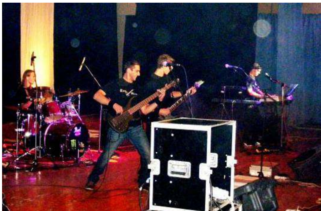
Koncertet adott a diákjainkból alakult együttes