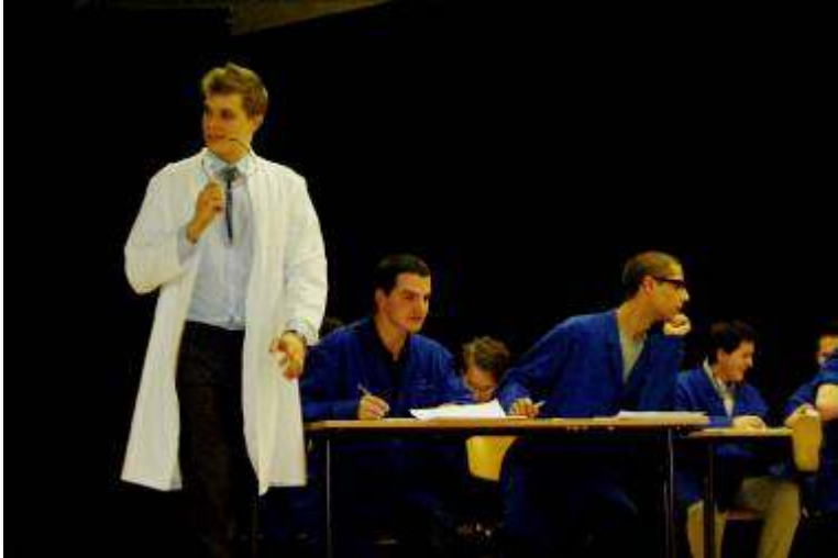
Honnan olyan ismerős ez a fehér köpenyes alak?