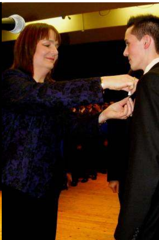
A szalag feltűzése a 12.A-ban