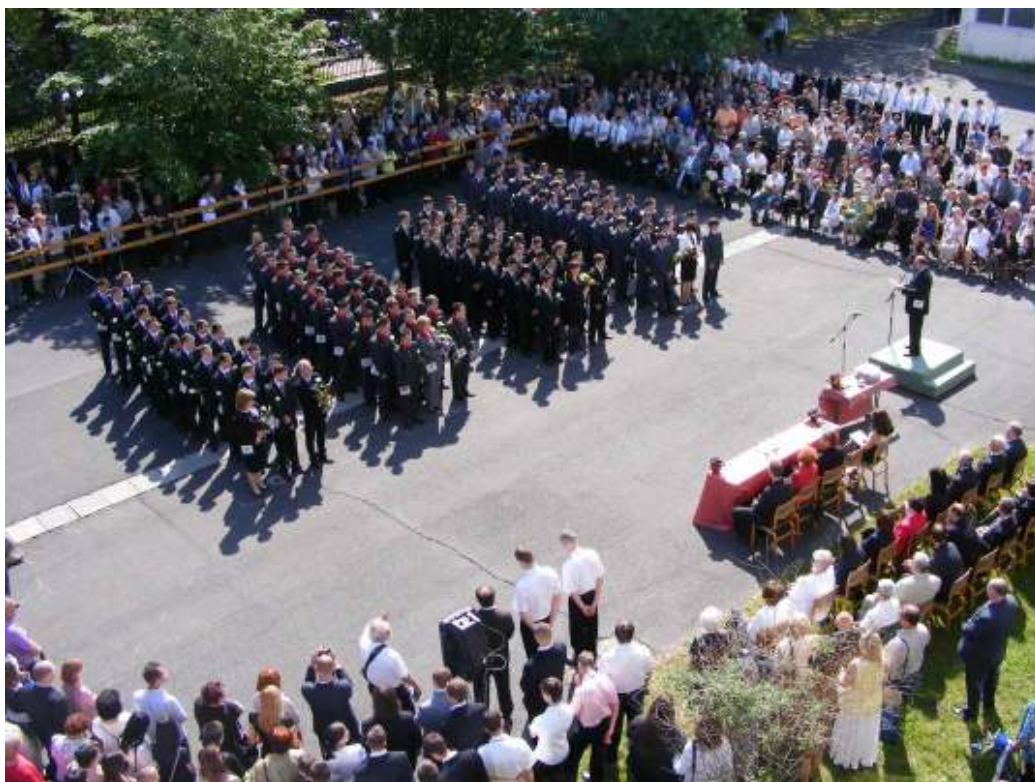
A ballagók - madártávlatból