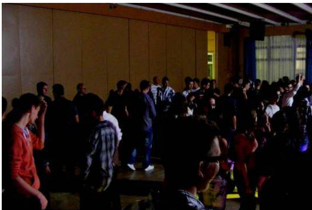
Indulhat a buli!