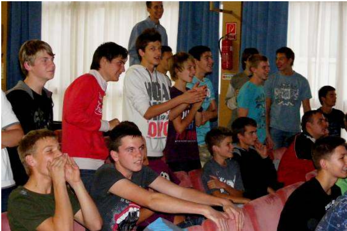
A lelkes szurkolótábor