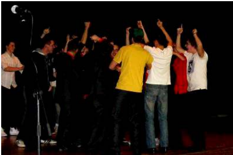
Bulihangulat a színpadon