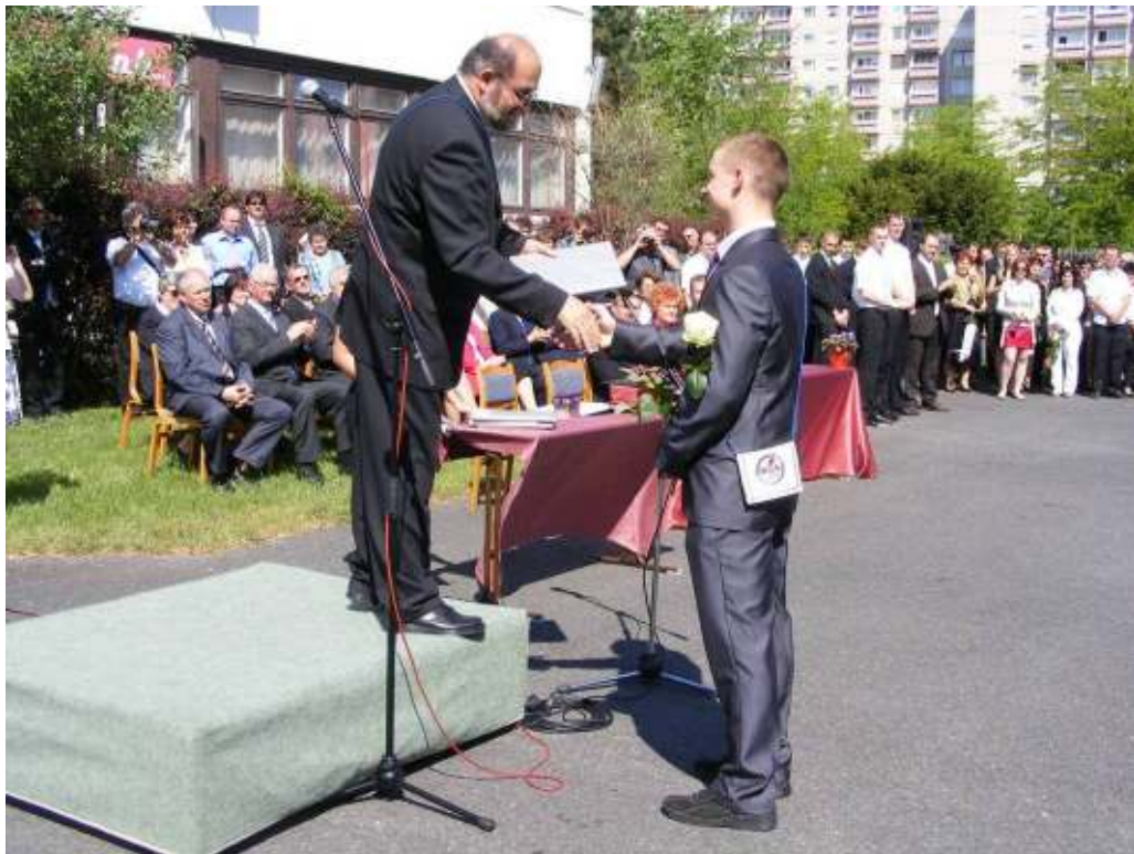
A legjobbak jutalmat vehettek át igazgató úrtól