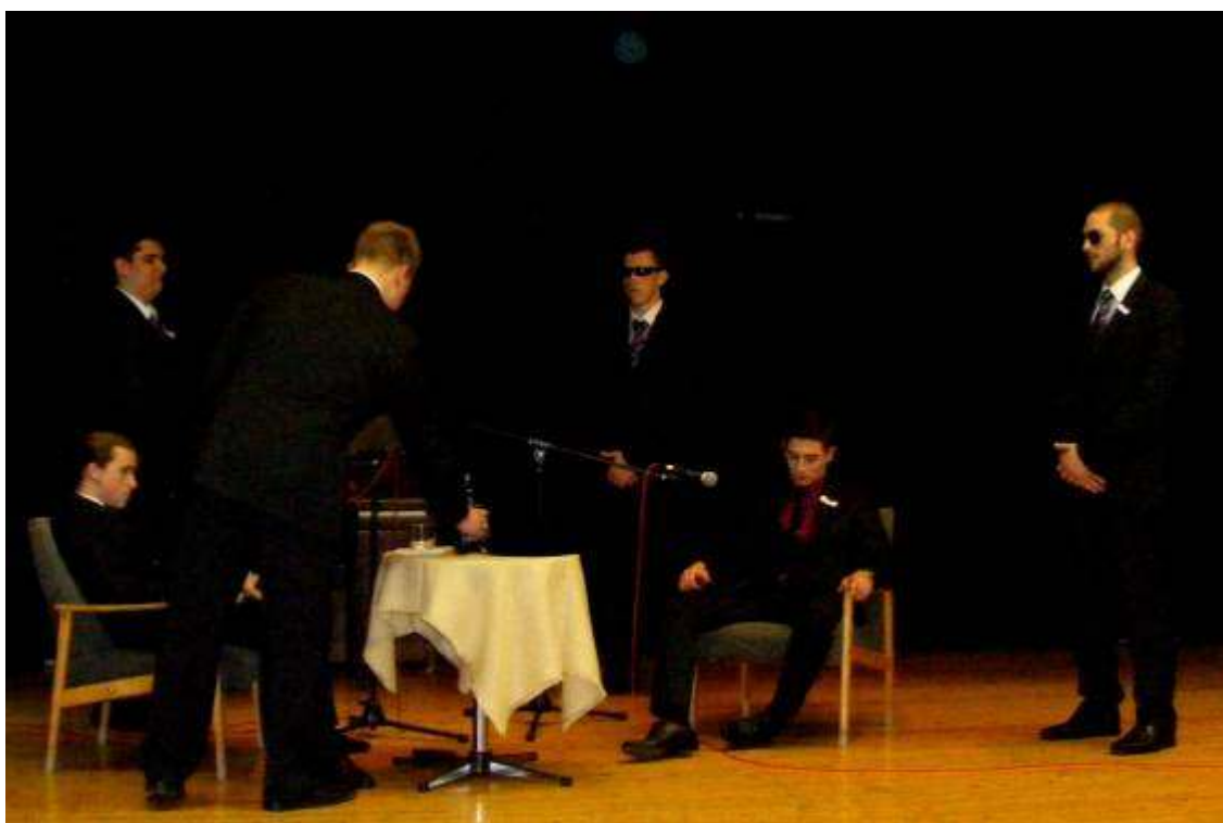
Maffiózók a 12.D-ből