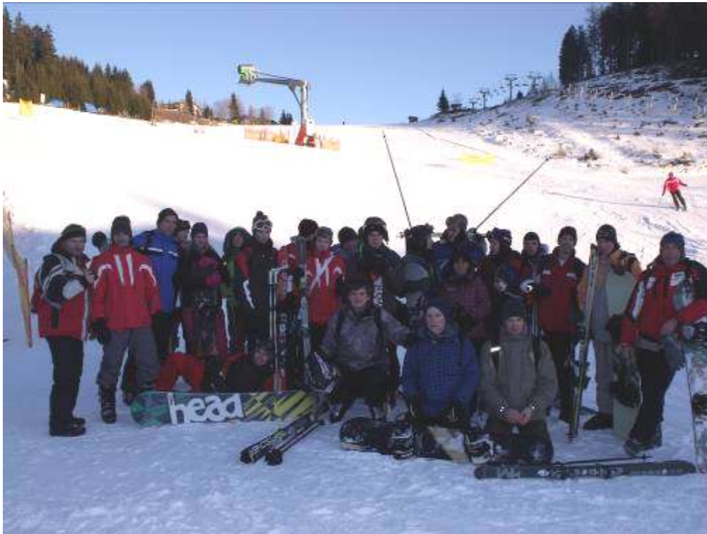
Síbajnokaink a gerlitzeni pályán