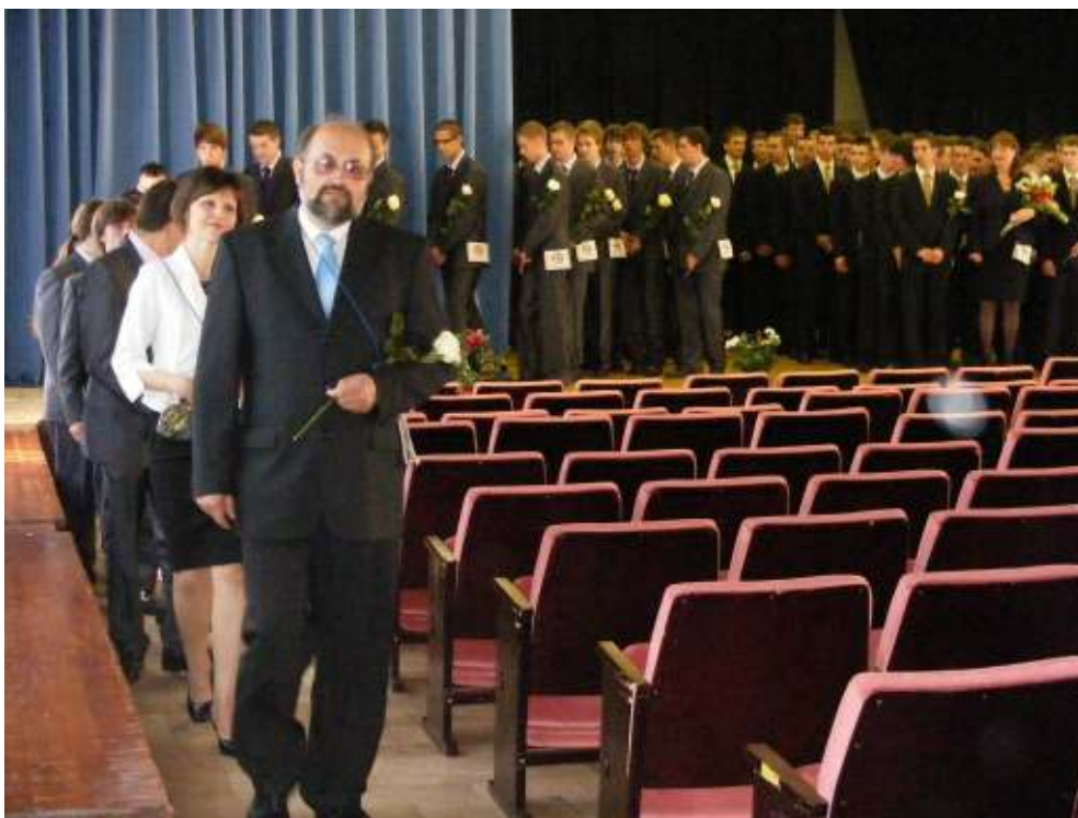
A ballagók csengőszóra indulnak el, hogy elbúcsúzzanak az iskolától