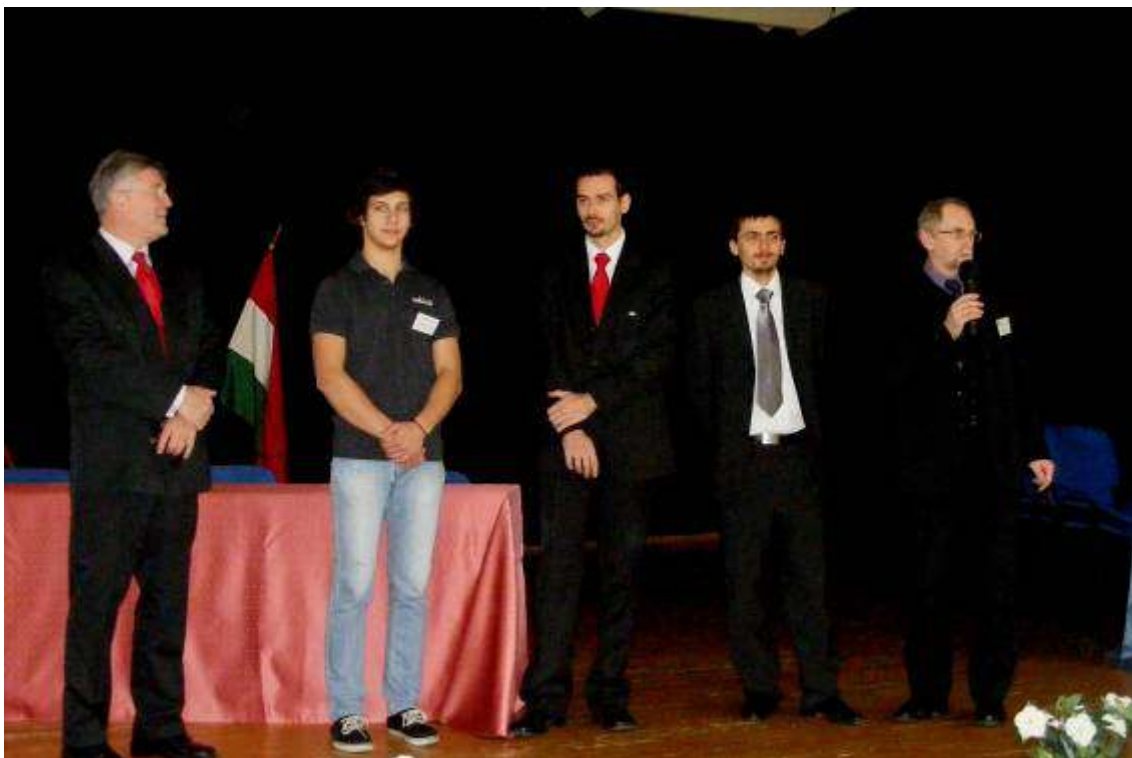
Élménybeszámolót hallgattak diákjaink korábbi szakmai világtversenyek résztvevőitől