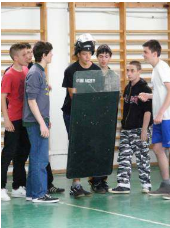
Ki szeretne ezután rendőr lenni?