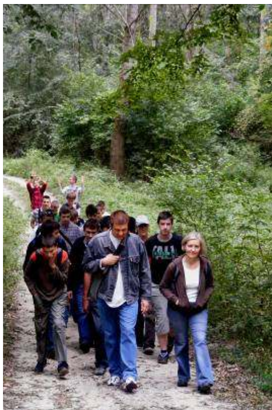
Ismerős túrázók az erdei utakon