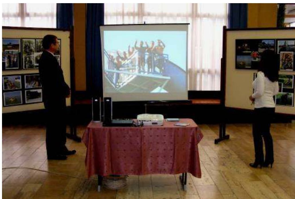
Az aulában fotók és vetítés illusztrálta az iskolai életet