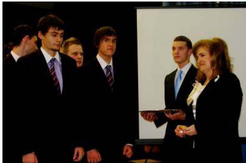
... a 12.D-ben