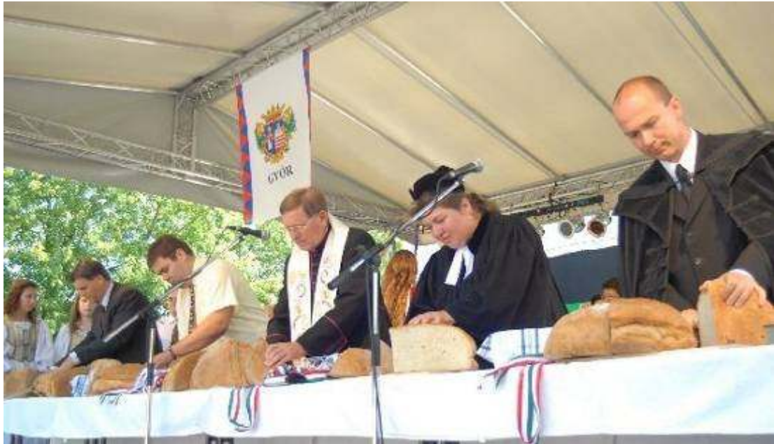
A kenyérszegés ünnepélyes pillanatai