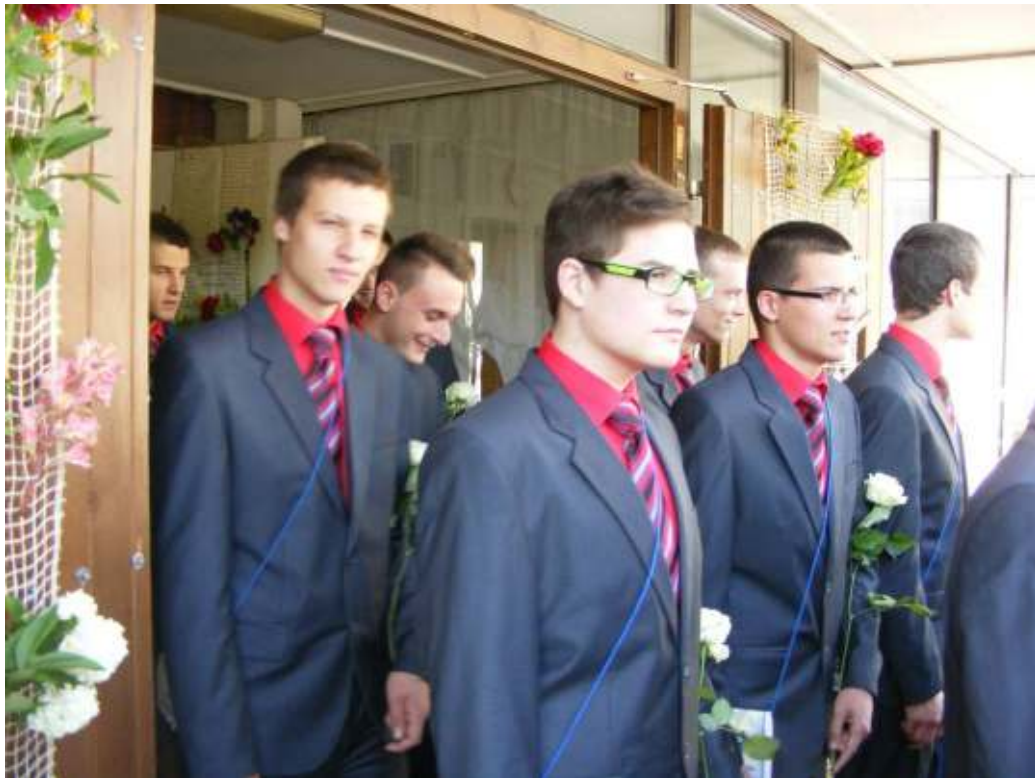
Kilépés az iskola kapuján ... az ÉLET-be!