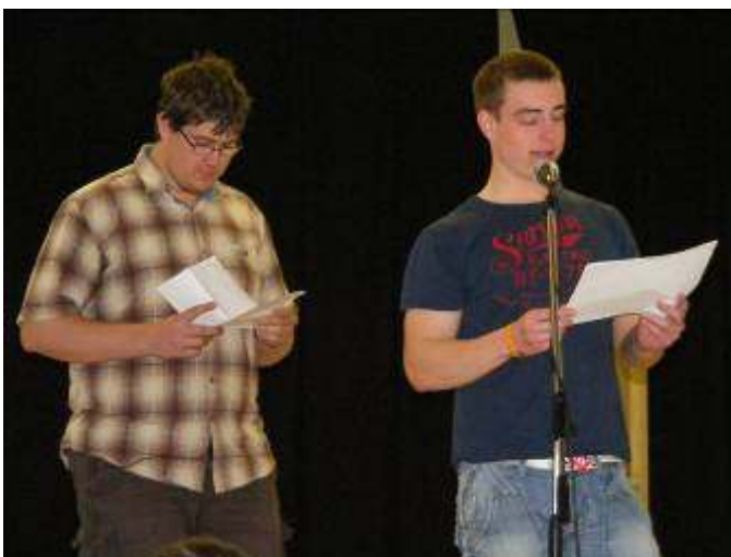
Örkény egypercesei diákok előadásában