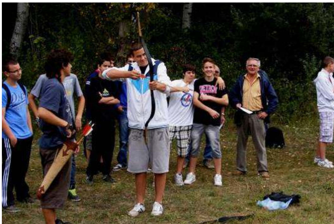
Az íjászatot is kipróbálhattuk